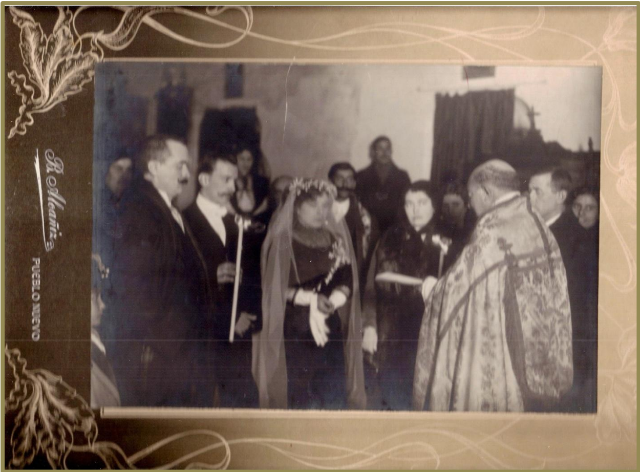
(Composición 33 x 24)