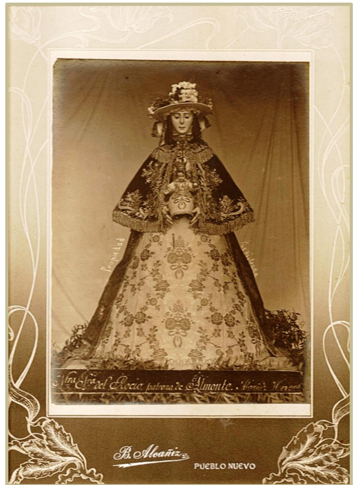
La Virgen del Rocío, en la celebración del 1º Centenario Del "Rocío Chico" (Agosto de 1.913) (Composición 24 x 33)